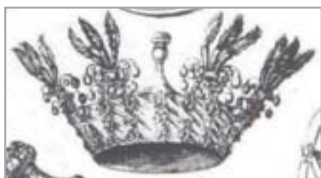
تصویر ۲. تاج شاه سلیمان (کمپفر، ۱۳۶۳: ۴۹)