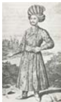
کفش راحتی (سیوری، ۱۳۷۲: ۲۷)