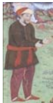
کفش راحتی (آژند، ۱۳۸۹: ۴۹۲)