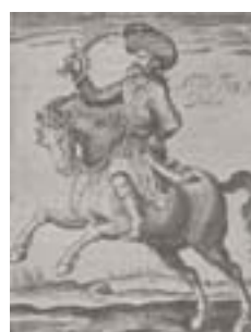
چکمه با نوک برگشته (فیگوئروا، ۱۳۶۳: ۲۷۱)