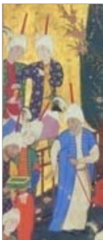
تصویر ۱. اشخاصی با تاج قزلباش (رجبی، ۱۳۹۰: ۱۰۶)

- دستار و عرق‌چین؛ دستار ایرانی که دل‌بند نامیده می‌شود و گرمی‌ترین و محترم‌ترین پوشاک ایرانیان است، چندان سنگین است که به زحمت و زحمت وزنش را روی سر تحمل می‌توان کرد. این دستارها عموماً از پارچه سفید درشتی درست شده که روی آن را پارچه لطیف ابریشمین یا ابریشمین زرتاری می‌پیچند. روحانیون روی کتان درشت و خشن، پارچه بسیار نازکی می‌پیچند، پارچه دستار به قطعه پارچه گلدار و