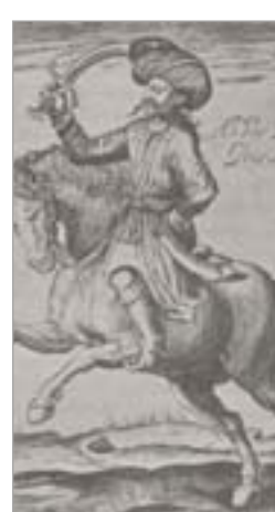
تصویر ۲۴. شاه‌عباس با چکمه (فیگوتروا، ۱۳۶۳: ۲۷۱)