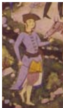
شلوار زیر زانویی (آژند، ۱۳۸۹: ۴۴۱)