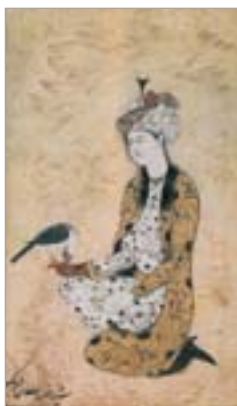
تصویر ۱۴. خسرو سلطان قوشی را در دست گرفته، اثر محمد یوسف (سودآور، ۱۳۸۰: ۲۹۴)

- جوراب ؛ توصیفات شاردن از جوراب ایرانیان نیز قابل توجه است. او جوراب ایرانیان زمان صفویه را این‌گونه توصیف می‌کند: «پیش از آن که ارامنه باب بازرگانی ایران و اروپا را بگشایند، ایرانیان جوراب به پا نمی‌کردند، حتی پادشاه مانند سربازان، رانندگان ارابه‌ها، پیک‌ها و بسیاری از افراد عادی که مچ‌پیچ به ساق پای خود می‌پیچند، پاتابه به پایش می‌پیچید. بعدها ایرانیان جوراب را از پارچه پشمی، مانند یک کیسه بلند و باریک، بدون این که شکل ساق و پاشنه و پهنی پا را در نظر بگیرند، درست می‌کنند. ساقه جوراب را تا زیر زانو بالا می‌برند و در آنجا گره می‌زنند و روی محلی را که پاشنه پا در آن جا می‌گیرد، چرم قرمز رنگی می‌دوزند تا جوراب بر اثر تماس با کفش پاره نشود و اگر چنین نکنند پس از سه یا چهار روز سوراخ می‌شود» (شاردن، ۱۳۷۴: ۸۰۲)، (تصویر ۱۷).