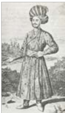
تصویر ۲۰. کفش مردان صفوی (سیوری، ۱۳۷۲: ۲۷)