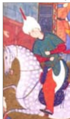
تصویر ۱۵. شلوار (کری‌ولش، ۱۳۸۴: ۹۴)