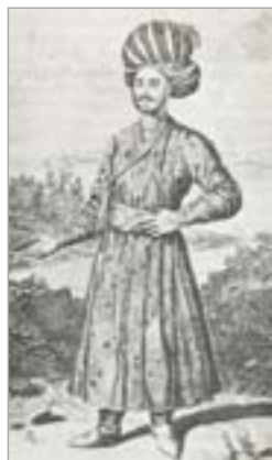
تصویر ۷. قبا‌ی مردان صفوی (سیوری، ۱۳۷۲: ۲۷)