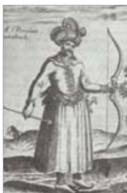
تصویر ۲۲. فرد قزلباش با کفش‌های نوک تیز برگشته (تاورنیه، ۱۳۸۳: ۲۵۴)