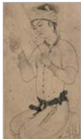
تصویر ۵. جوان نشسته در حال خواندن، با دو پیراهن، اثر شیخ محمد (پاکباز، ۱۳۸۳: ۱۱۴)

پرقیمت‌تری به عرض شش یا هفت شست منتهی می‌شود، که هنگام بستن دستار آن را مانند جیغ‌های (هرچیز تاج مانند که به کلاه نصب کنند) از داخلش درمی‌آورند؛ با این که دستار موصوف به تنهایی سنگین است، گاهی شب‌کلاه یا عرق‌چینی (تصویر ۳) از پارچه کتان مضرس یا ماهوت زیر آن روی سر می‌گذارند (شاردن، ۱۳۷۴: ۸۰۳ و ۸۰۴).