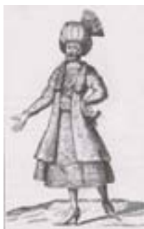
کفش پاشنه بلند (سانسون، ۱۳۷۷: ۳۵)