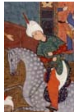
شلوار (کری ولش، ۱۳۸۴: ۹۴)