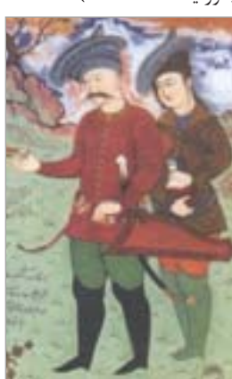
تصویر ۲۵. بخشی از نگاره شاه‌عباس و خان عالم، چکمه‌های سوارکاری (آژند، ۱۳۸۹: ۴۹۲)