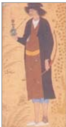
تصویر ۲۶. گیوه، نشمی کماندار، اثر رضا عباسی (کتابی، ۱۳۸۴: ۲۲۹)