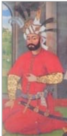
تصویر ۴. کاخ چهلستون، شاه‌تهماسب با پیراهن گلدار (آقاجانی و همکاران، ۱۳۸۶: ۷۰)