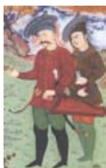
چکمه سوارکاری (آژند، ۱۳۸۹: ۴۹۲)