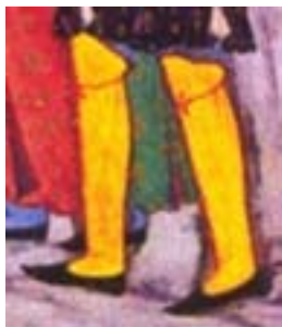
جوراب (کری ولش، ۱۳۸۴: ۳۸)