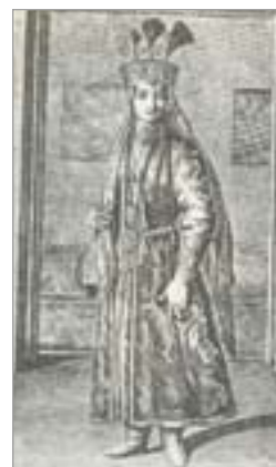
تصویر ۲۱. کفش بانوان صفویه (فیگوتروا، ۱۳۶۳: ۱۵۹)