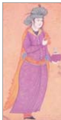
تصویر ۱۳. ساقی، اثر رضا عباسی (کوریان، ۱۳۷۷: ۱۵۶)