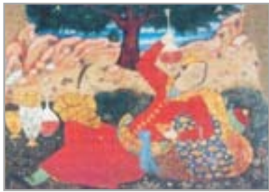
تصویر ۳. بخشی از یک دیوارنگاره کاخ چهلستون؛ شخصی با عرق‌چین بر سر و دستار روی زانو (آقاجانی و همکاران، ۱۳۸۶: ۴۵)

از بازو به پایین تنگ می‌شود و روی مچ‌ها می‌چسبد. همچنین این قبا تا کمر، تنگ و از کمر به پایین گشاد می‌شود. یک طرفش، با نوارهایی از همان پارچه به زیر بغل وصل می‌شود و طرف دیگر از روی آن می‌گذرد و زیر بغل راست بسته می‌شود (تاورنیه، ۱۳۸۳: ۹۱ و ۹۲).