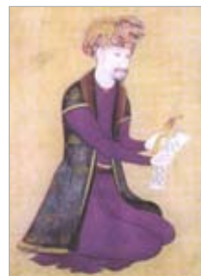
تصویر ۱۱. خلیفه سلطان وزیر با لباس کردی، اثر معین مصور (سودآور، ۱۳۸۰: ۲۸۹)