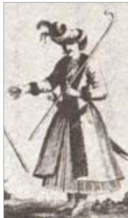
تصویر ۱۰. مردی با تن پوش کاتبی، از سفرنامه شاردن (شاردن، ۱۳۷۴: ۸۰۰)

یا با پا کارهای سخت انجام می دهند، بسیار خوب و مناسب است. جنس پارچه مچ پیچ به اقتضای فصل، درشت و ضخیم، یا نازک و لطیف است، و وقتی خیس یا آلوده به گل شود آن را خشک می کنند و گلپایش را می زدایند. هنگام زمستان آنان که ناچارند ساعات زیادی بیرون از خانه راه بروند، پای خود را نیز مانند ساق پایشان در پاتابه می پیچند (تصویر ۱۶). تاورنیه درباره مچ پیچ در سفرنامه خود می نویسد: «پیش از ورود اروپاییان، مردم خبر از جوراب نداشتند و همه مانند سربازان عادی و مردم فقیر عمل می کردند، که امروزه هم مچ پیچی از پشم بز به دور ساق پا می بندند و کف پا در کفش برهنه می ماند و فقط در فصل سرما آن را با نوعی پاپوش پشمی یا پنبه ای می پوشانند. این نوع پوشش پا بسیار راحت به نظر می رسد، به خصوص برای سربازان و مردم فقیر که غالب اوقات ناچارند که به زیر باران تند بروند یا از سیلابها گذر کنند، و کافی است که این مچ پیچ را در آورند و بگذارند تا در اندک زمان خشک شود و حال آنکه در اروپای ما برای خشک کردن جوراب خیس باید دو ساعت وقت صرف کنند و در آوردن آن