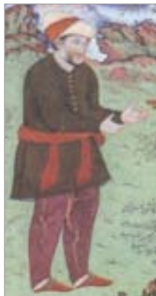
تصویر ۱۸. کفش‌های راحتی، بخشی از نگاره شاه‌عباس و خان عالم (آژند، ۱۳۸۹: ۴۹۲)

شاردن یکی از معروف‌ترین سیاحان دوره صفویه درباره کفش‌های ایرانیان می‌نویسد: «کفش‌های ایرانیان به انواع گوناگون است و برای اینکه بیشتر دوام کند، پاشنه آنها را میخ‌کوبی می‌کنند، و تخت آنها را آنجا که به سرپنجه فشار وارد می‌آورند نیز به همین منظور چند میخ ظریف می‌زنند. افراد باشخصیت و جاه‌مند، کفش‌هایی می‌پوشند که شبیه کفش راحتی بانوان است و بدین سبب است که هنگام واردشدن به اتاق خانه، آسان بتوانند آن را از پا بیرون کنند زیرا کف اتاق‌ها مفروش است و بدون کفش باید در آن درآیند. کفش ایرانیان به رنگ سبز و دیگر رنگ‌هاست. تخت آنها مثل مقوا نازک اما سخت و پردوام