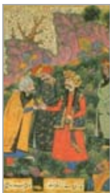
تصویر ۲۳. شاه‌عباس، محمود و ایاز، اثر محمدعلی (رجبی، ۱۳۸۴: ۵۲۴)

- گیوه؛ بعضی از کفش‌های ایرانی‌ها مانند جوراب‌های ما با میل بافته شده، اما بسیار محکم‌تر است. راه رفتن با این نوع کفش بسیار راحت و آسان است و پا در آن نمی‌لغزد و نمی‌چرخد. اما بدون پاشنه‌کش به راحتی نمی‌توان آن را