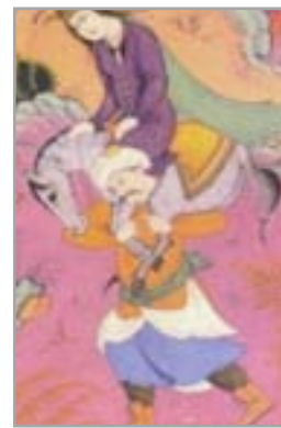
تصویر ۱۹. بخشی از نگاره شاه‌عباس و خان عالم با نیم‌چکمه بنددار، اثر رضا عباسی (کنبای، ۱۳۸۴: ۱۶۷)