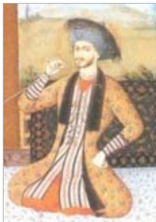
تصویر ۶. بخشی از نگاره شاه‌سلیمان و درباریان، اثر علیقلی جبه‌دار (کنبای، ۱۳۸۶: ۱۵۳)

بزرگ‌تر، جادارتر و مطمئن‌تر است (شاردن، ۱۳۷۴: ۸۰۱). - دستکش؛ زنان و مردان ایرانی دستکش به دست نمی‌کنند. بهتر و روشن‌تر بگویم، اصولاً مردمان مشرق زمین از فایده دستکش بی‌خبرند (شاردن، ۱۳۷۴: ۸۰۷). البته لازم است بیان شود که صفویان هنگام شکار یا دست‌آموز کردن