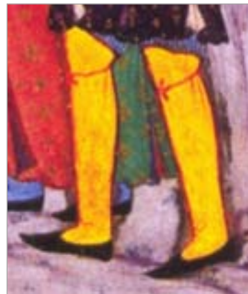
تصویر ۱۷. جوراب، بخشی از نگاره مرگ ضحاک، اثر سلطان محمد (کری‌ولش، ۱۳۸۴: ۳۸)