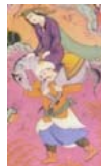
کفش نیم چکمه بنددار (کنبای، ۱۳۸۴: ۱۶۷)