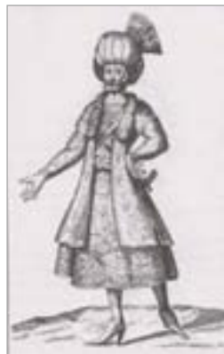
تصویر ۱۲. یک مرد قزلباش با تن پوش کردی (سانسون، ۱۳۷۷: ۳۵)

باز و یا دیگر پرندگان شکاری، از دستکش استفاده می کردند. در تصویر ۱۴، خسرو سلطان دیده می شود که برای نشان دادن پرنده شکاری روی دستش، از دستکش استفاده کرده است.