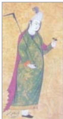
تصویر ۸. قبا، اثر افضل‌الحسینی (غیبی، ۱۳۸۷: ۴۶۶)

- کاتبی (کادبی)؛ روی قبا نیز چیزی می‌پوشند که برحسب اقتضای فصل، اگر زمستان باشد لبه‌دار و با آستین است و به آن کادبی می‌گویند. برش این پوشش مانند قباست، یعنی بالایش تنگ و پایینش فراخ است و آن را از ماهوت یا اطلس ضخیم زرتار می‌دوزند و با یراق یا توری مزین می‌کنند یا با قلاب‌دوزی می‌آرایند. دوختشان چنان است که مانند شال گردن، تاناف را می‌پوشاند، و از بالا تا پایین یک رشته دکمه، تنها به‌منظور تزیین به آن می‌دوزند، زیرا این دکمه‌ها را به ندرت می‌بندند (شاردن، ۱۳۷۴: ۸۰۱ و ۸۰۲). نمونه آن در بخشی از نگاره، شاهقلی خان که سندی را مهر می‌کند، مشاهده می‌شود (تصویر ۹). شاهقلی خان و فردی که پشت سرش ایستاده کاتبی پوشیده‌اند. نمونه دیگر کاتبی در تصویر ۱۰ که برگرفته از سفرنامه شاردن است، دیده می‌شود.