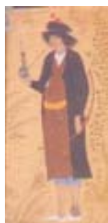
گیوه (کنبای، ۱۳۸۴: ۲۲۹)