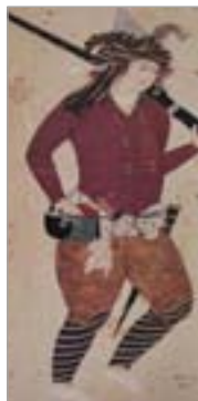
تصویر ۱۶. مچ‌پیچ، جوان تفنگ به دوش، اثر حبیب‌الله ساوجی (آژند، ۱۳۸۹: ۶۴۸)